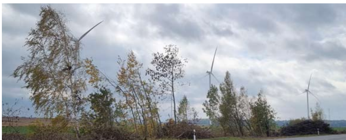
Staškūniškyje esančios elektrinės taip ir nepradėjo veikti.