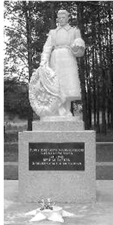
Sovietų kario skulptūrą laikinai saugos komunalininkai.