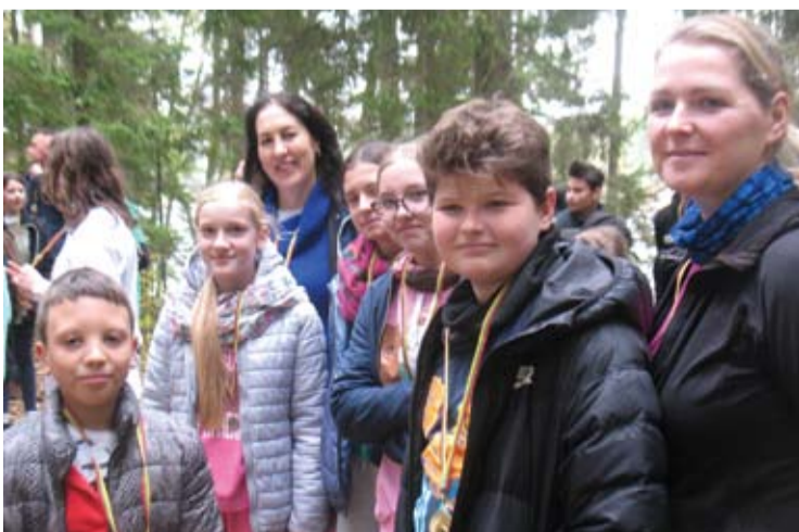
Smagiai nusiteikę svėdasiškiečiai.