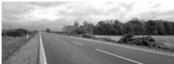
Stakūniškio topolių alėja mirties bausme nuteista už jos kolegų nusikaltimus.